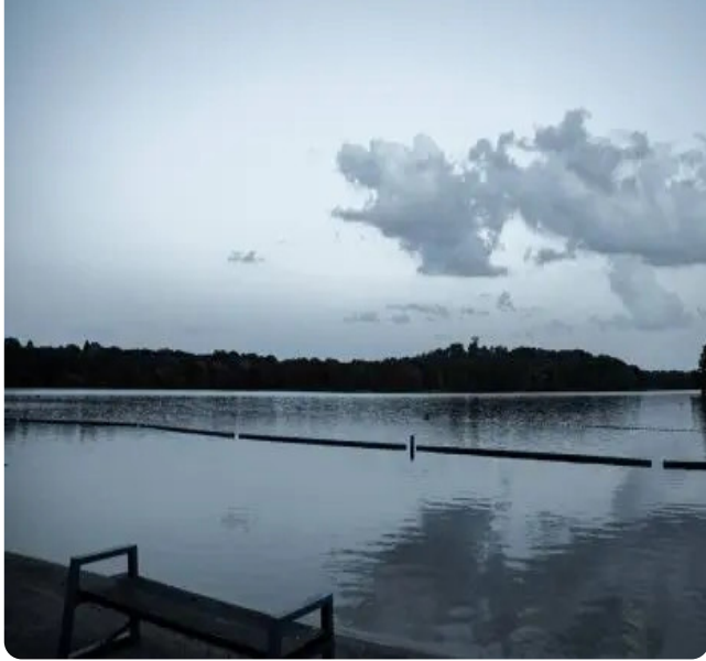
Bild WolfsseeBild WolfsseeBild Wolfssee